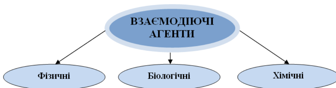
Рис. 2. Система псування

Біопшкодження є істотним результатом великої кількості взаємодій пошкоджуючих агентів, які можуть бути біологічними, хімічними та фізичними (рис. 2). Проте відносний вплив цих агентів часто визначається природою та ступенем людського втручання.