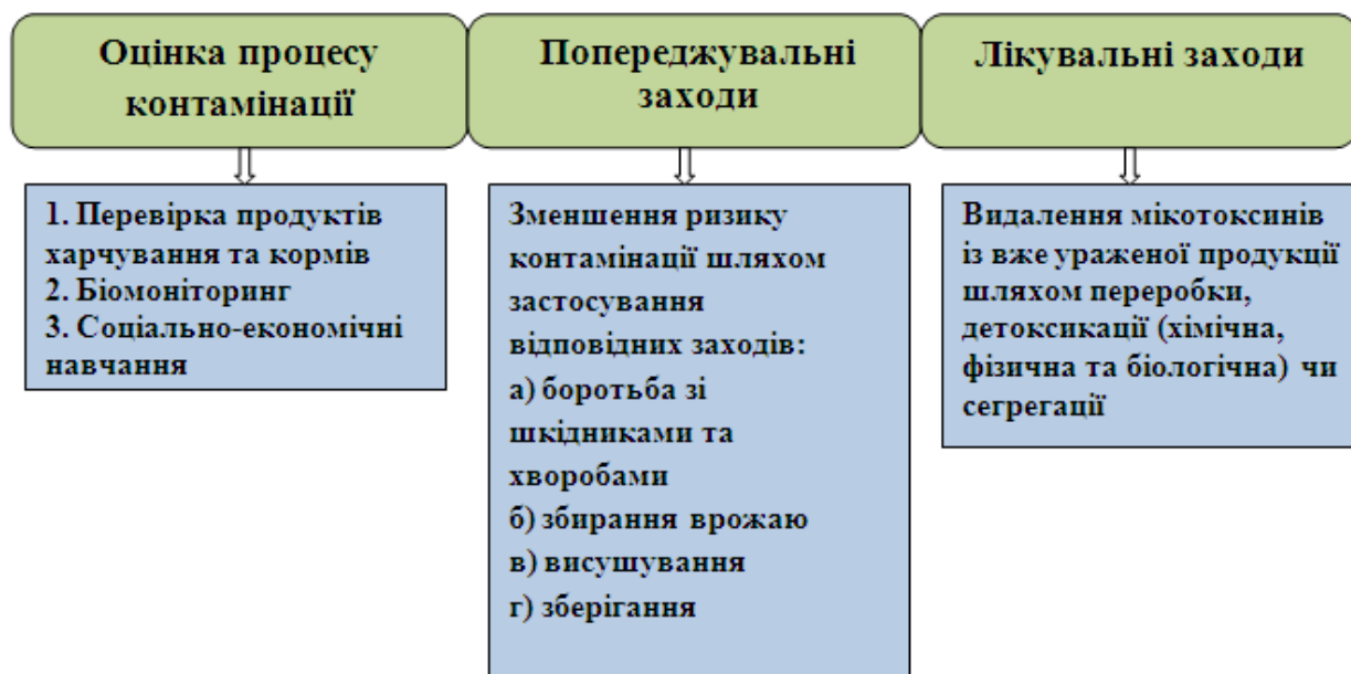
Рис. 4. Контрольна система

Соціально-економічна система описує ті соціальні (культурні, політичні) та економічні (макро- та мікро-) фактори, які можуть істотно впливати на систему мікотоксикології. Вони повинні бути враховані за організації контролю мікозних грибів і мікотоксинів. У деяких випадках, з врахуванням складності та непередбачуваності людської поведінки, може бути дуже важко успішно втрутитись у соціально-економічну систему. Тим не менш, технічні заходи, які використовуються для зменшення псування харчової продукції, будуть успішно застосовані лише в певній соціально-економічній системі. Кожен раз за спроби покращити якість продуктів та кормів потрібно чітко враховувати, чи існує нагальна потреба отримання продукту більш високої якості і чи суспільство готове нести будь-яке пов'язане з цим збільшення витрат? Контрольна система ілюструє вибір профілактичних та лікувальних заходів, що можуть бути використані для контролю мікотоксинів тоді, коли характер забруднення харчового чи кормового продукту був достатньо вивчений (рис. 4).